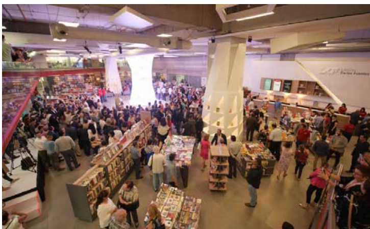
Panorámica de la Librería Carlos Fuentes en la UdeG.

Una serie de prestaciones adicionales brindarán a los usuarios las comodidades necesarias para que su experiencia de compra sea tan grata como prolongada y constante: cafetería, espacios para lectura, servicio de impresión bajo demanda, oferta de papelería, de artículos de diseño y objetos de regalo.