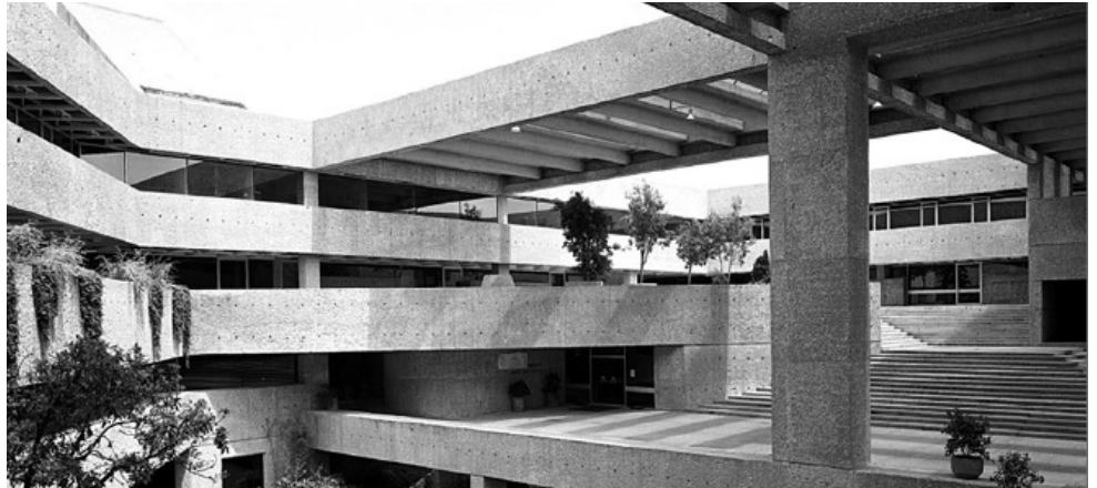
Edificio de El Colegio de México. Tomado del libro conmemorativo de los 50 años de la CANIEM